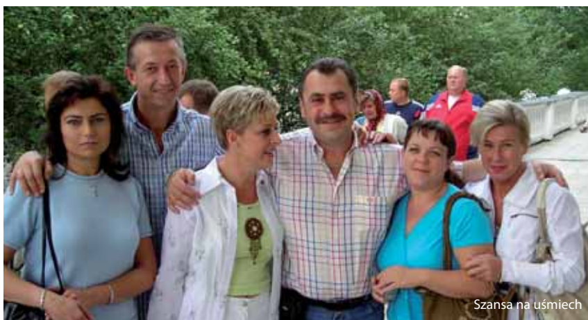
Szansa na uśmiech