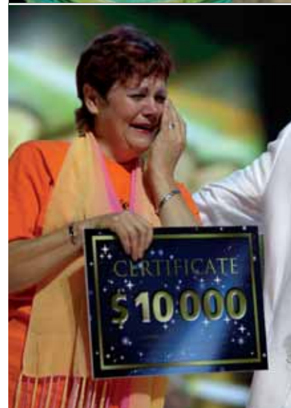
Zwyciężczyni Akcji Be Lucky z Rosji