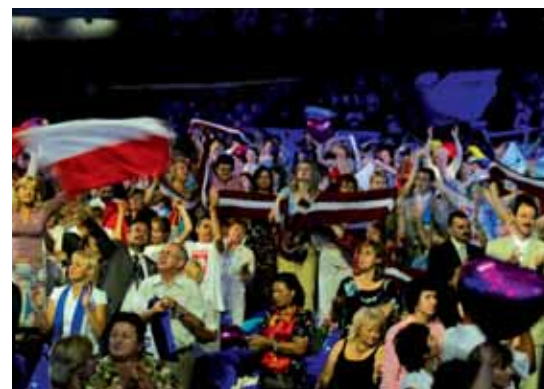
Dystrybutorzy z różnych krajów.