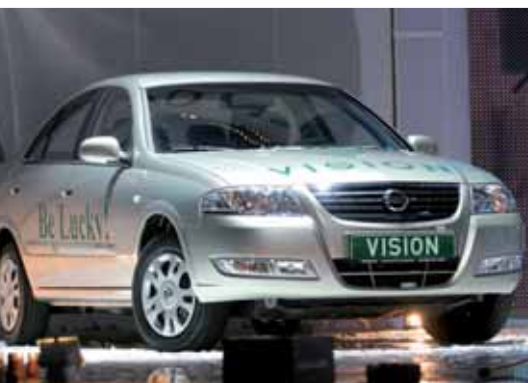
Jedna z nagród z pakietu Life Style Vision

Wyjazd do Moskwy na dziesięciolecie firmy, czyli Millenium, był dla mnie naprawdę dużym przeżyciem. To, co tam zobaczyłam, utwierdziło mnie w przekonaniu, że chcę związać swoją przyszłość z firmą Vision. Oglądając to wszystko, co się działo na wspaniałej scenie, i słuchając wykładów topliderów Firmy, poznając ich osobiste historie, uświadomiłam sobie, że jak potężna, a zarazem niezwykłą Firmą mam do czynienia.