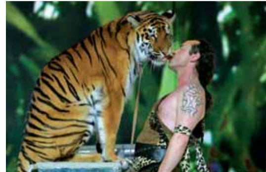
Fragment nadzwyczajnego show

Tegoroczne Millenium to 10-lecie Vision International People Group. To niesamowite wydarzenie po raz kolejny utwierdziło mnie w przekonaniu, że pracuję we wspaniałej Firmie. Millenium, to spotkanie z wieloma tysiącami ludzi, którym ta Firma zmieniła życie. Millenium za każdym razem motywuje do intensywniejszej pracy. Dlaczego? Codziennie mijamy na ulicy ludzi, którzy mają problemy. Zdrowie i finanse to zmartwienie milionów osób. Vision to dla mnie misja pomocy drugiemu człowiekowi. To nie jest przypadek, kiedy spotykamy kogoś w potrzebie. To przeznaczenie, kiedy trafia do nas osoba potrzebująca pomocy zdrowotnej lub osoba z ogromnym potencjałem do pracy w marketingu. Vision odkrywa ten potencjał w ludziach, budzi chęć niesienia pomocy i rozwijania własnej osobowości.