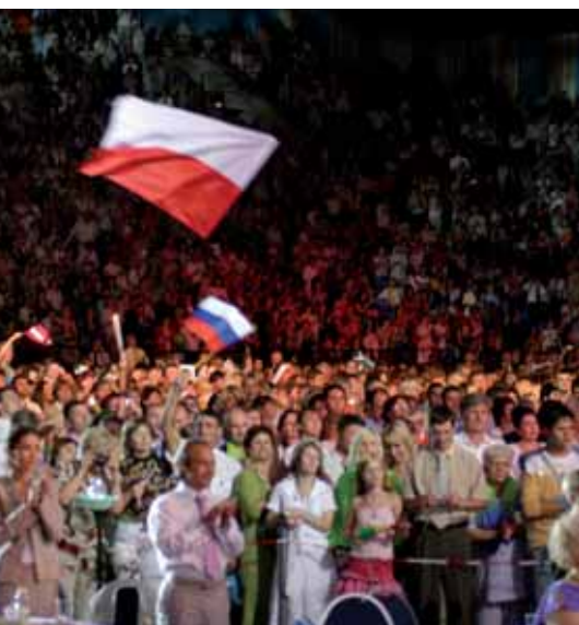
Polska flaga powiewająca na stadionie Olimpijskim