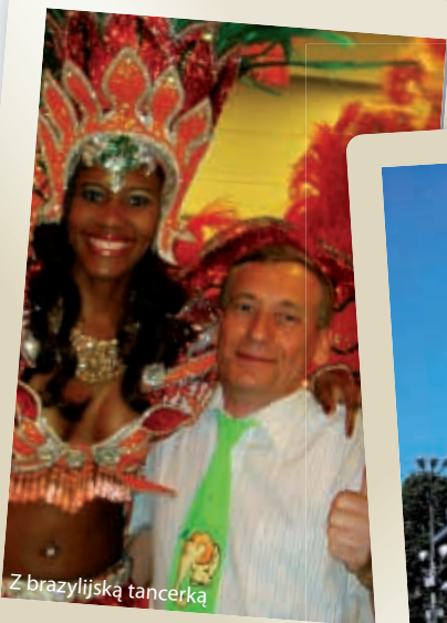
Z brazylijską tancerką